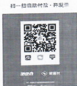
线上缴费及增值税普通发票